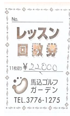
レッスンチケット